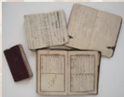
▲田山花袋従軍日記・手帳類(田山花袋記念文学館所蔵)