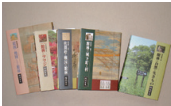
『館林市史』特別編第1～3巻、資料編

『館林市史』は、通史編3巻・特別編7巻・資料編6巻の全16巻を刊行する予定です。館林の自然、歴史、民俗などさまざまな分野から、特色ある文化遺産を紹介し、未来へ伝えていきます。