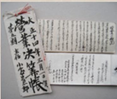
▲大正時代の営業概況記録(小室家文書)