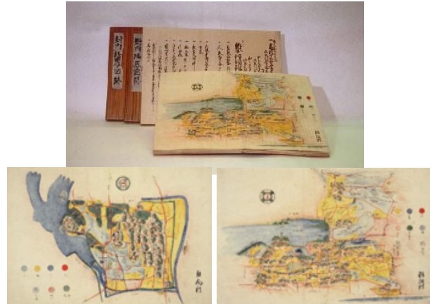
⑩ 封内経界図誌 ほうないけいかいずし