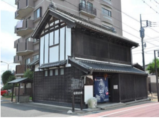
③② ぶんぶくしゆぞうてんぼ けづか きんかん 分福酒造店舗[毛塚記念館]