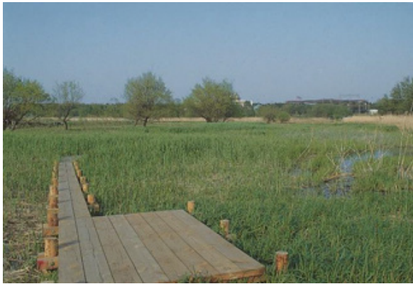
① 茂林寺沼及び低地湿原