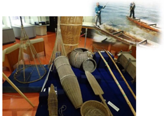
⑪ 沼の漁具と白舟 ぬまぎよくひなたぶね