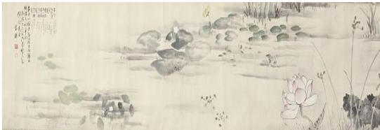
⑭ 上毛館林城沼所産水草図