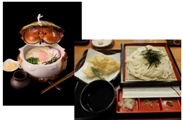
③⑦ なてばやし 館林のうどん