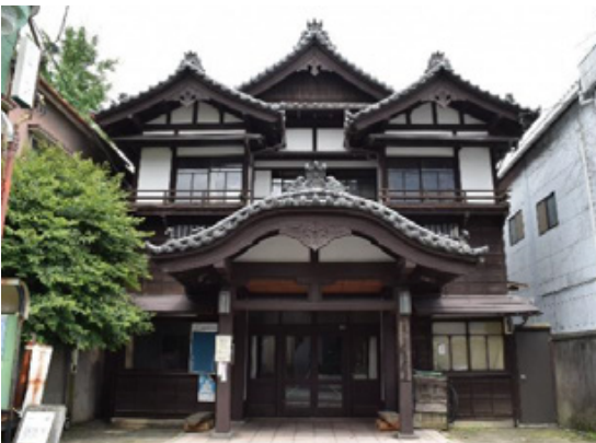
③④ きゆうたてばやし に ぎやうけんぼんくみあいじ むしよ 旧館林二業見番組合事務所