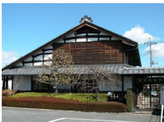
②⑧ 正田醤油(株)旧店舗・主屋[正田記念館]