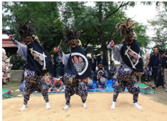
⑨ 上三林のささら かみみばやし