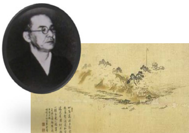
②⑥ 小室翠雲画「邑楽公園躑躅ヶ岡之図」