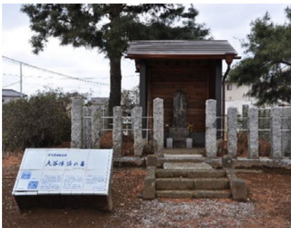
⑧ 大谷休泊の墓 おおやきゅうはくほか