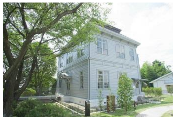
③⑩ 創業期日清製粉館林工場事務所 [製粉ミュージアム本館]