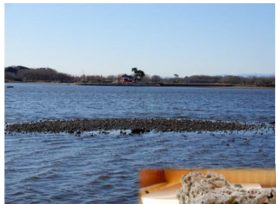
⑥ 多々良沼遺跡(カナクソ)