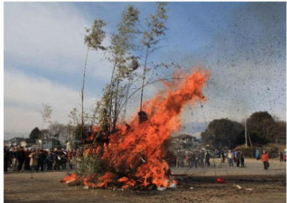
④ 堀工町のどんど焼き