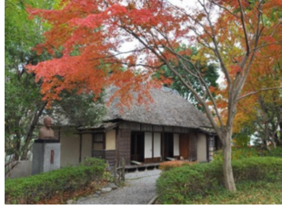
③⑤ た やま か たい きゆう きよ 田山花袋旧居