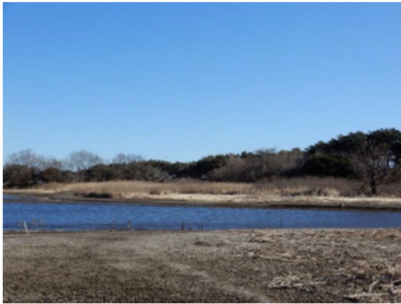
⑦ 内陸古砂丘 ないりくこさきゅう