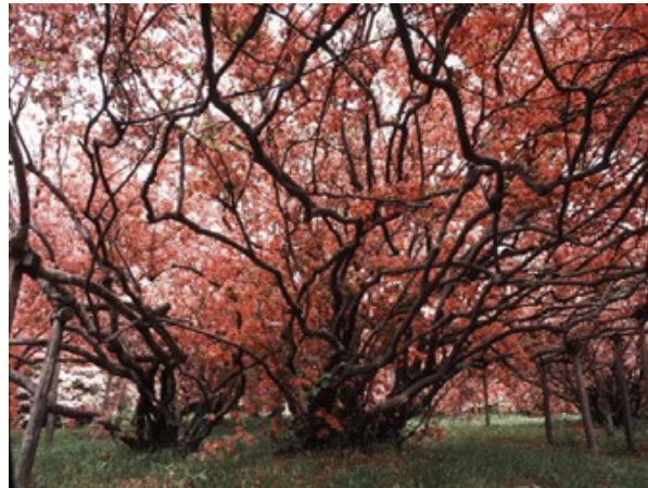
⑱ 躑躅ヶ岡(躑躅)[つつじが岡公園]