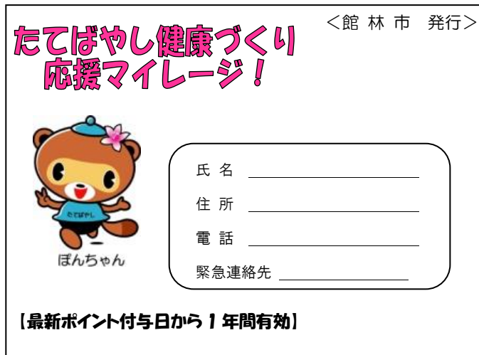
マイレージカード(表)