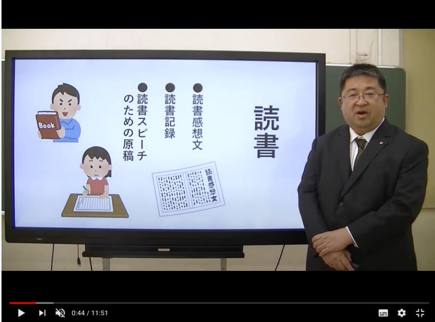
授業「読書のすすめ-本の種類・読書感想文」 | 国語 | 小学校中学年~中学生 | 群馬県

tsulunos で 『読書のすすめ』の授業は 観てくれたかな?! 何で読書するの? から 感想文の書き方まで 分かりやすく教えて くれているよね。 もしまだ観ていないなら ぜひ、ミ・テ・ネツ!