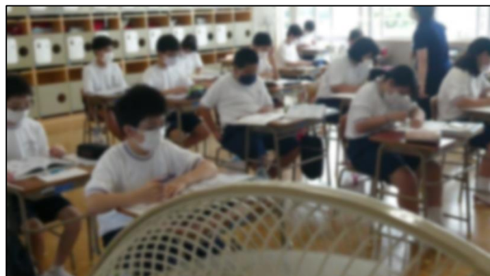
扇風機二台体制で換気しています。