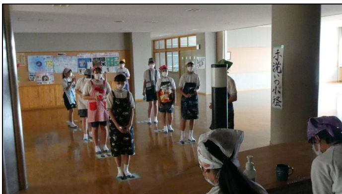
給食前の手洗いです。間隔をとっています。

6月15日から、4時間とはいえ全員登校の通常授業が始まりました。また翌日の16日からは、1時間ですが部活動も再開しました。学校に少しずつ「日常」が戻ってきています。油断することなく、文部科学省や市のガイドラインに沿って「新しい生活様式」での学校にしていきます。