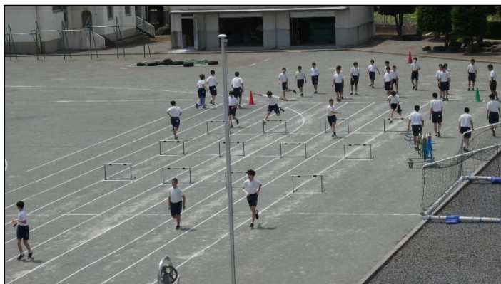
特に体育は、三密と熱中症対策を意識しています。