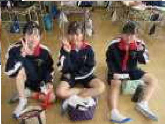
男子優勝 1組 総合優勝