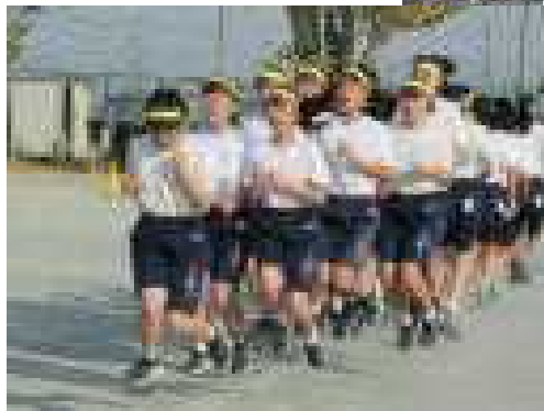
チームジャンプ優勝2組