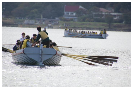
1年榛名高原学校・カッター訓練

チーム準優勝とBチームは3位。これまでの練習の成果が出てよかったですね。1年生は9日からの1泊2日の 榛名高原学校 で友情と一体感を高めました。学級では、新たな