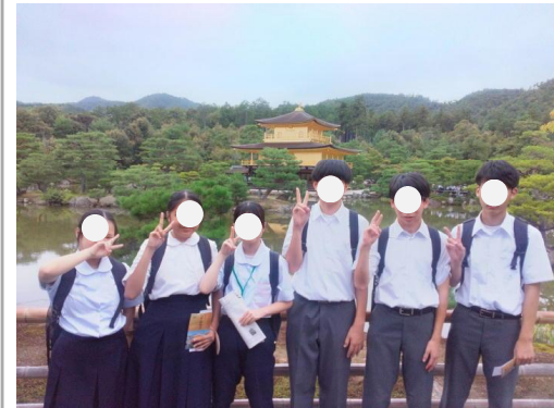
3年修学旅行・金閣寺にて

進路を見つめました。1年生は高原学校の事前学習、3年生は修学旅行での班別行動計画の作成と、日々忙しくも充実していました。3年の先生たちは、 高校入試説明会 が始まり、こちらも熱が入ってきました。駅伝競走大会へ向けての練習は佳境に入り、熱中症予防対策を講じながら日々のトレーニングも充実してきました。そんな中、3年生は24日から2泊3日の 修学