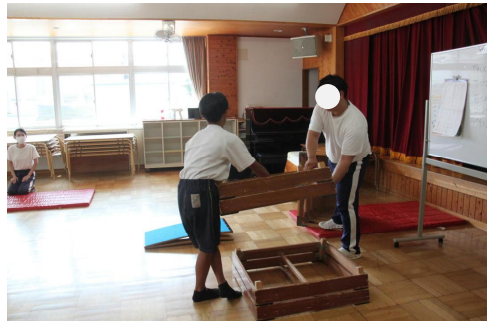
2年職場体験・こども園MINOYAにて

体育館も照明がLEDになり気持ちも新鮮になりました。1学期の反省をいかして成長した2学期にしようと思んだ人も多しはず。今はどうでしょうか? 復習確認テスト で夏休みの学習の成果を計りました。“よっしゃ”という人、“自分は夏休みに何をやってたんだろう…”という人もいたようですね。1,2年生は 新人大会 が始まり、2年生は2日間の 職場体験学習 で自己の