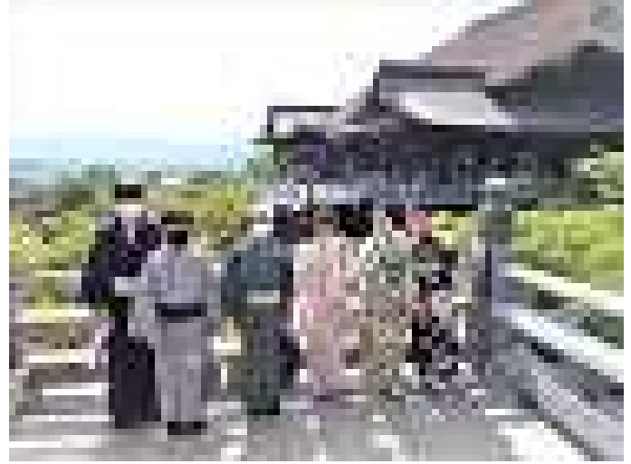
清水の舞台を背景に