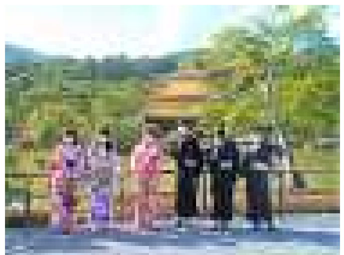
世界遺産「鹿苑寺金閣」