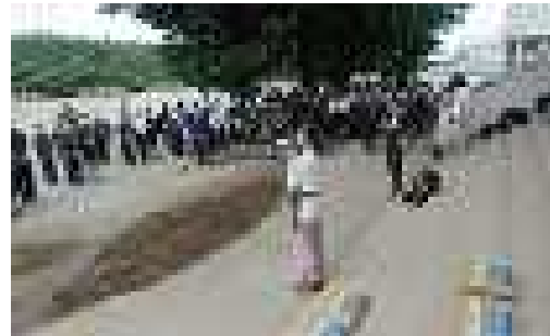
PTA T会長のお礼のあいさつ