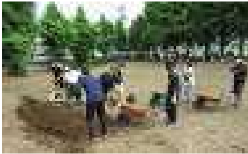
道路の穴埋めに土を運びました

5月15日(日)PTA美化活動が行われました。 たくさんの方が参加してくれたので、きれいになりました。ゴミ置き場には、ゴミ袋が山のようにになりました。ありがとうございました。 次回は、11月13日(日)になります。よろしくお願いします。