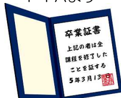
卒業証書ホルダー