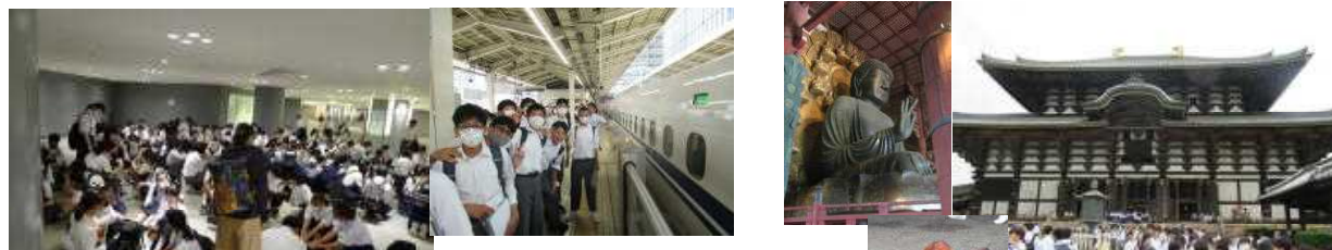
東大寺と奈良公園