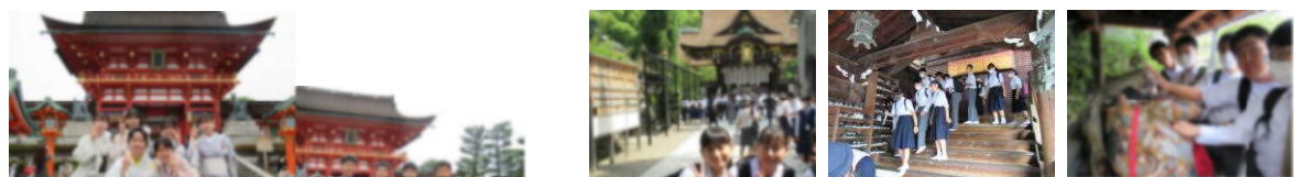
北野天満宮・・・神妙な面持ちで昇殿参拝