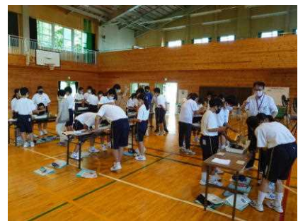
【里沼学習の水質実験】

新型コロナウイルス感染症の流行のために、高原学校に行けずに残念な思いをした1年生でしたが、1年生はそれに負けずに貴重な体験を自らつくり上げています。