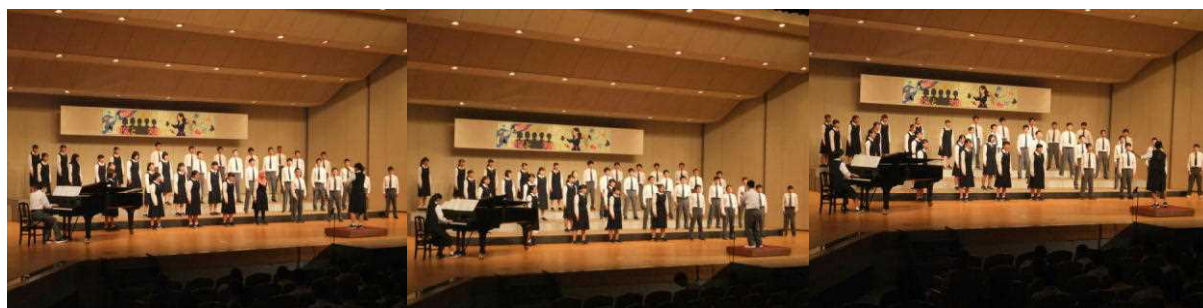
【3年各学級の合唱発表】