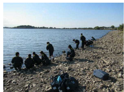
【多々良沼の水質調査】

10月30日（金）から11月10日（火）までの全学年の三者面談では、大変お世話になりました。生徒たちのさらなる成長と自己実現に生かしていきたいと思っております。今後ともご家庭と学校の連携をよろしくお願ひします。