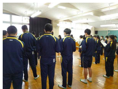
【昼休みの合唱練習(マスク着用)】

いつもの年よりも十分な練習期間を設けられなかったり、練習ではマスクを着用したりするなど、多くの制約がある中でも、3年生は毎日努力を積み上げました。運営面でも3年生の実行委員を中心に感染症対策のためにさまざまな工夫をしながら準備をしました。本番当日では、座席やステージ上の立ち位置の間隔を空けるなど、いつもと違った光景でしたが、3年生は「今できること」に全力を尽くしました。どの学級の合唱も3年生の気持ちのこもったすばらしいものでした。ステージの後ろには美術部が作り上げた看板も輝いていました。