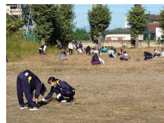
【校庭の除草作業の様子】

10月25日（日）に、前期にできなかったPTA美化活動を行いました。保護者・生徒・職員の約200名が集まり、校内の除草や清掃を行いました。お陰様で安全で気持ちのよい学校生活を送ることができます。ご協力ありがとうございました。11月15日（日）にもう1回予定していますが、大変お世話になります。