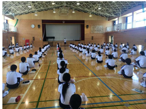
部活動説明会の様子

また、7月から月曜日や定期テストの際は、制服登校になります。 いよいよ部活動もスタートします。三年間継続できる部活を選びま しょう！7/2(木)が部活動編成になっています。入部届(保護 者の押印)を忘れないようにしましょう！！