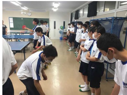
部活動見学(男子卓球部)