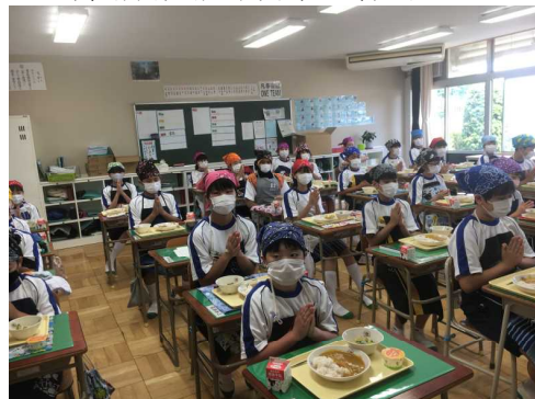
給食「いただきます」風景