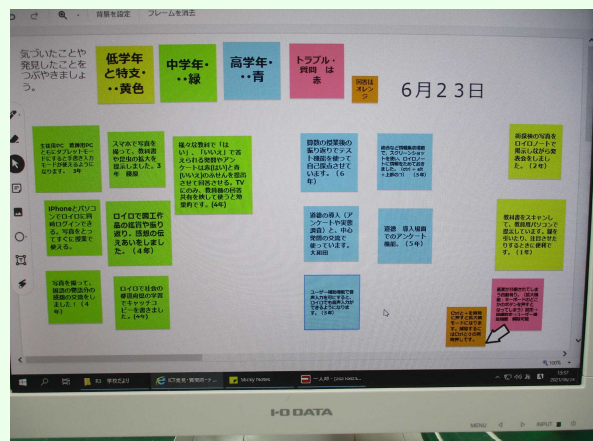
PC上の掲示板で情報を共有

校内を巡ると、毎日いずれかの教室で活用している様子を見ることができます。児童も教師も、まずは使い慣れることが必要です。様々な教科の学習で使用しながら、操作能力の向上を図り、有効な活用の在り方を模索しています。