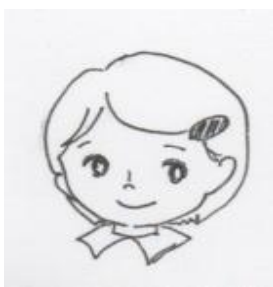
前がみをピンでとめる