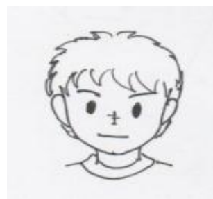
前がみを短めにする