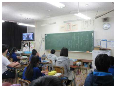
【放送中の教室の様子】

あなたは、そんな2人の会話を聞いてしまいました。この後、あなたはどのようにしますか？