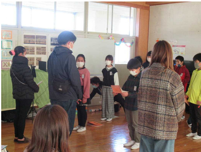
かんしや 感 謝のお手紙をわたしました。ちよつ とてれくさかったけど、がんばって読み ました。