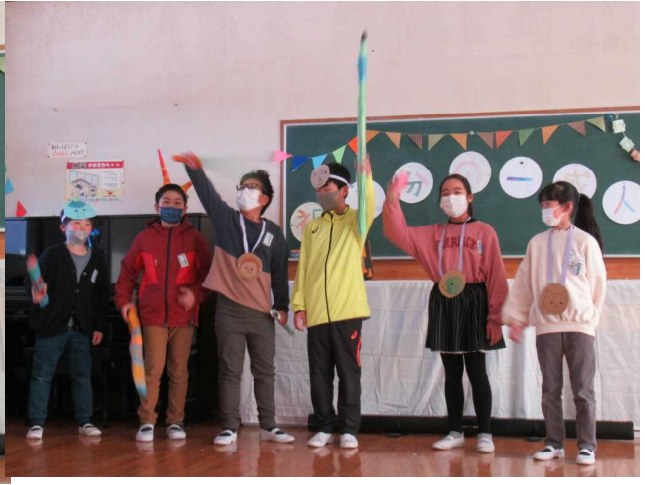
はつびよう げきの発 表もしました。みんな堂々と発 表できたね。 どうどうとはつびよう