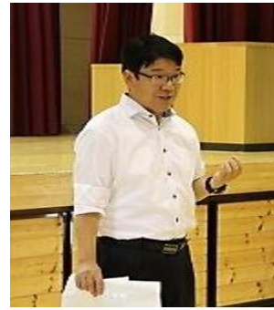
館林市立第七小学校