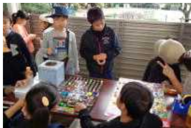
お楽しみのスーパーボールくじ

10月19日、PTA主催のバザーを開催致しました。地域の皆様からの多数の品物を提供していただき、会場は賑わい大盛況のうちに終了することができました事、大変嬉しく思います。