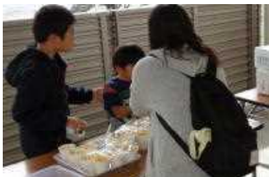
フライドポテトとフランクフルトも