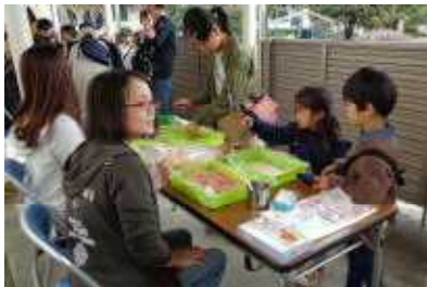
子どもたちに人気のらくがきせんべい