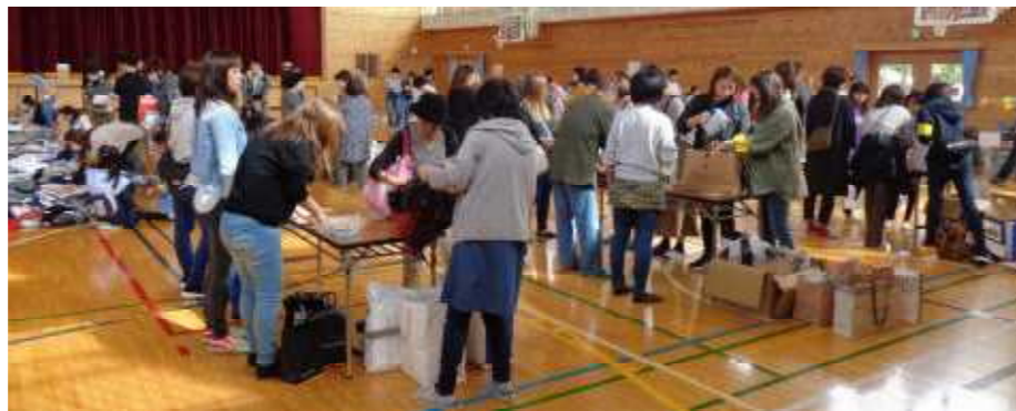
スタッフの皆さんお疲れ様でした。

今後のPTA活動におきましても、ご理解とご協力の程、宜しく PTA副会長 ■■■