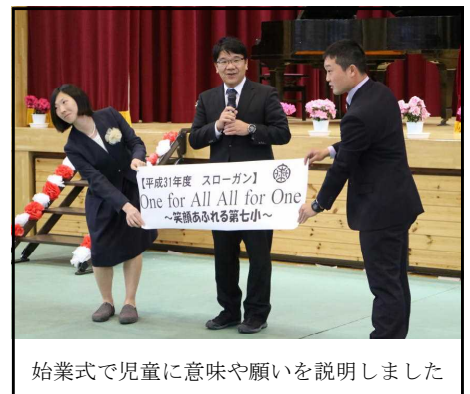
始業式で児童に意味や願いを説明しました