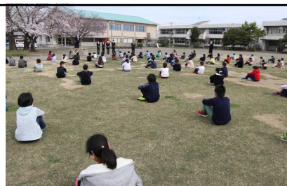
ドキドキの担任発表