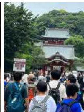
6年修学旅行 (鎌倉・江ノ島)