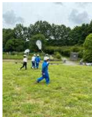
3年校外学習 (ぐんま昆虫の森)