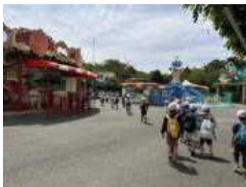
2年校外学習 (華蔵寺公園)