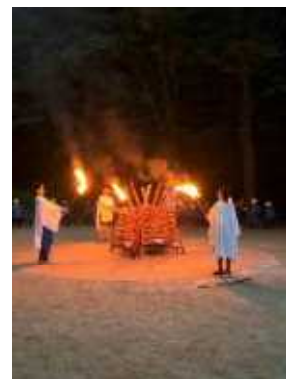
5年林間学校 (東毛青少年自然の家)