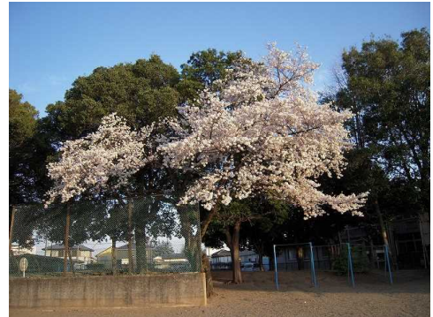
【バックネット付近の桜】

また、学校は保護者や地域の方、関係機関の方々のご理解とご協力がなければ、前に進むことはできません。学校での児童の様子や、学校の方針をお伝えするためにも、この学校だより「六GOっ子」を定期的に発行していく予定です。