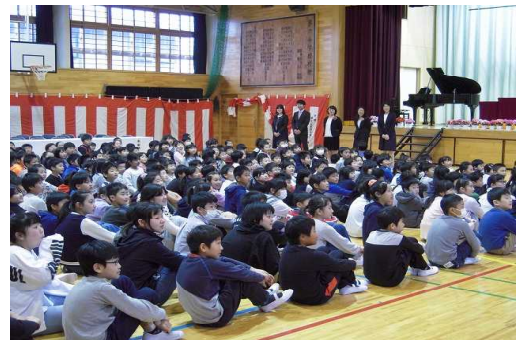
【新任式・始業式の様子】

校歌も大きな声で歌い、話を聞く態度も立派で、とても素晴らしい新任式・始業式だったと思います。これからの1年間が、とても楽しみです。