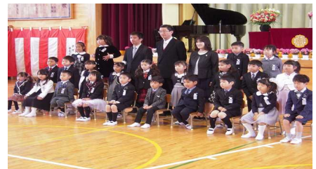
【記念撮影も無事終了】

また、式の中で1年生に、次の3つのお願いをしました。「友達と仲良くし、思いやりのある優しい子になってほしい」「しっかりあいさつのできる子になってほしい」「命を大切にしてほしい」という3つです。続いて教育委員会の方や、長柄PTA会長のお話も、どの子もしっかり話を聞いていました。また、担任の先生からの呼名にもしっかり返事をしていました。早く学校生活に慣れ、元気に楽しく過ごしてほしいと思います。