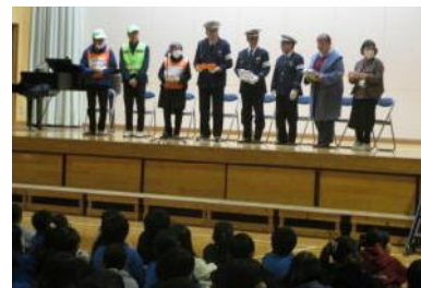
【お越しいただいた皆様】

3/10(火)の朝行事の時間、感謝の集会が開かれました。日頃お世話になっている防犯パトロール、読み聞かせ、日本語指導ボランティア、そして、交通指導員の皆様をお招きし、子どもたちから手紙と歌をプレゼントさせていただきました。子どもたちの安全と、豊かな心の醸成に尽力くださっている多くの皆様に、心より感謝申し上げます。今後とも、どうぞよろしくお願いたします。