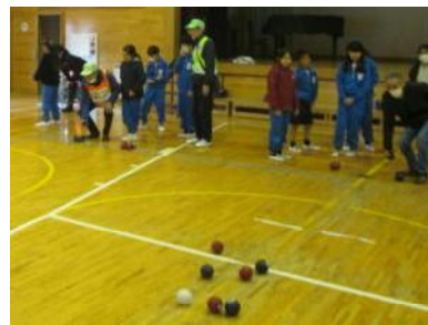
【ポッチャでの交流】