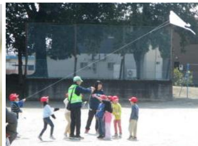
【駒回しや凧あげを楽しむ子どもたち】