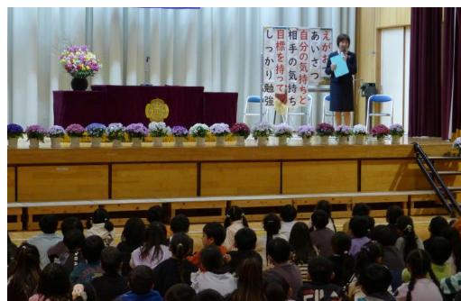
【始業式に臨む子どもたち】

この3つを心に留めて、あいさつと笑顔あふれる第六小学校を、みんなでつくってほしいと思います。