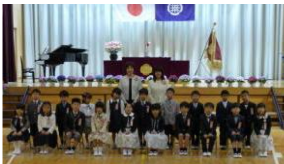
【1年1組の子どもたち】

改めまして、保護者の皆様、お子様のご入学おめでとうございます。そして、ご臨席を賜りましたご来賓の皆様、ありがとうございました。