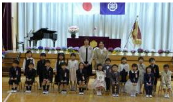
【1年2組の子どもたち】