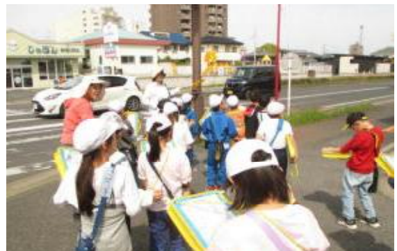
【まちの様子をメモする子どもたち】

4/17(金)の5, 6校時、3年生が、社会科「わたしたちの住んでいるところ」の単元で、学校の周りの様子を確認するために、「まち探検」をしました。畑が少なく、住宅が多いこと、クリニックやお店が多くあることを確認しました。また、茂林寺線のバスが往復しているのに遭遇し、バス停も見つけられました。ちょうど電車も通っている時間で、子ども達は大喜びでした。学校に戻ると、確認してきたことを共有し、ノートにまとめていました。