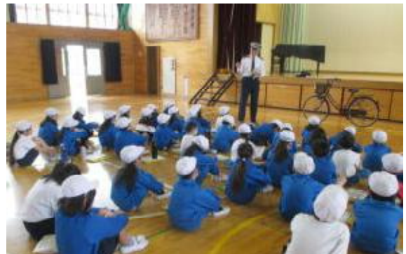
【真剣に話を聞く子どもたち】

配付された資料を参考にして、ご家庭でも、自転車の乗り方等について、お子さんと話し合ってくださいと思います。昨年度、六小児童の交通事故はゼロでした。今年度も、子どもたちの安全を願っています。