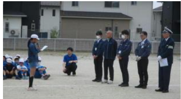
【お礼の言葉を述べる代表児童】