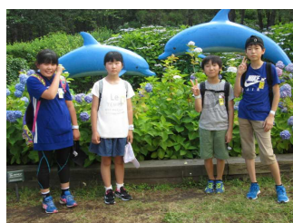
＜八景島シーパラダイス＞

この2日間の修学旅行は、子どもたち一人一人にとって、教室では学べない多くのことを学び、たくさんの収穫を得ることができました。この経験を生かし、今後、学校行事や様々な活動に取り組んでほしいと願っております。