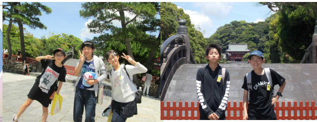
＜鎌倉のグループ行動＞