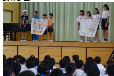
＜児童会本部、すばらしい！＞

もちろん担当の教員の指導もありますが、児童会本部の子どもたちが大変頑張って自分たちの思いを伝えられた素晴らしい発表でした。