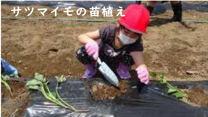
サツマイモの苗植え

長かった臨時休校期間が終わり、学校に子供達の元気な姿が戻ってきました。6月19日（金）までは全学年とも授業は4時間ですが、15日の月曜日からは給食も始まります。そして、完全に1日の授業時間がもとに戻るのは6月22日（月）からです。感染防止を意識した新しい生活様式を実践しながら、一日も早く生活リズムを取り戻し、心の安定が図れるよう個別の支援に力を入れていきます。ご家庭でもお子様の早寝早起きや授業準備の点検などへのご協力をよろしくお願いします。